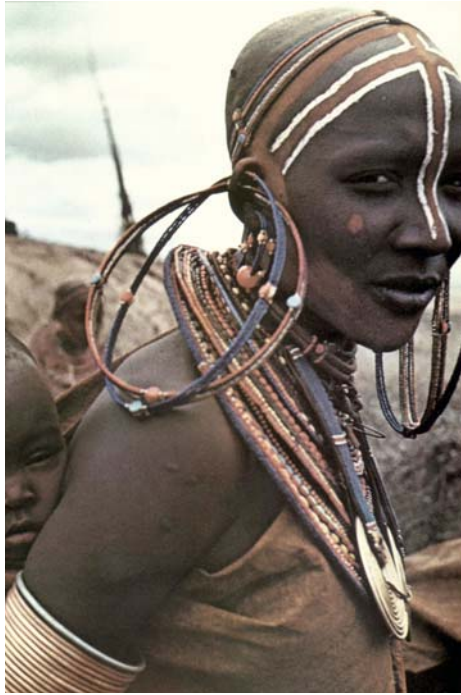
Las mujeres masai usan adornos y pinturas. La de la foto carga un niño a su espalda.