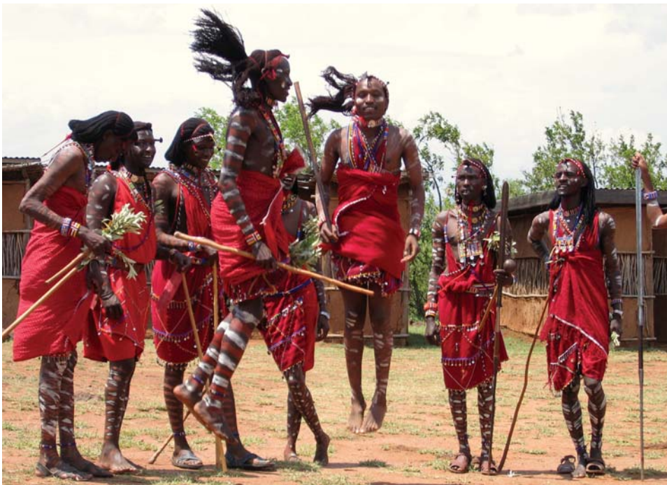
Ceremonia ritual llevada a cabo por los hombres de la tribu masai.