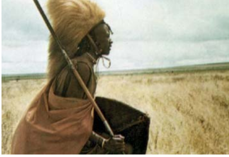
Un guerrero luce la crin de un león.