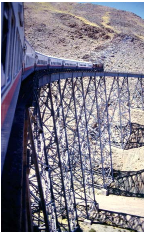
Tren de las Nubes. Va desde la ciudad de Salta hasta el Viaducto de La Polvorilla en un recorrido que dura 15 hs. Debe su nombre a que es uno de los trenes más altos del mundo: las vías sobre las que transita llegan a estar a 4.200 m sobre el nivel del mar. Hoy está destinado al turismo.

Las relaciones conceptuales que se presentan en los párrafos anteriores forman parte de aquello que consideramos significativo que los chicos construyan y aprendan. A continuación, se presentan tres secuencias didácticas con propósitos, actividades y niveles de complejidad diferentes para abordar en el aula.