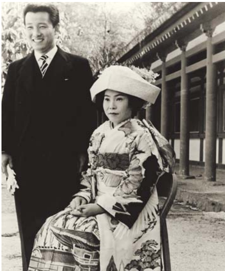
Cart / Unesco Photobank