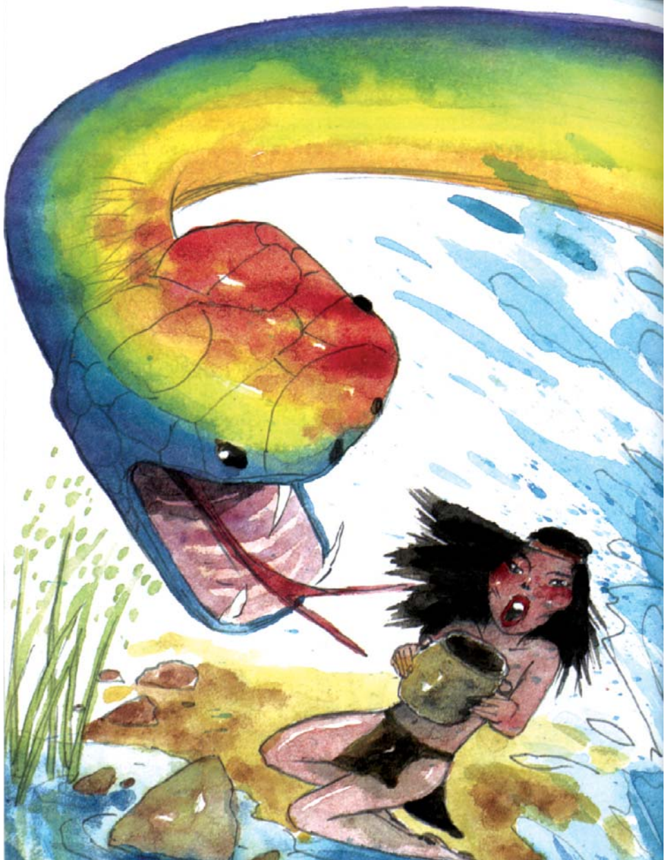
Ilustración de Huadi, en: Leyendas, mitos, cuentos y otros relatos tobas , Buenos Aires, Longseller, 2003

Y así fue como dejó de ser fácil conseguir la caza. Pero Ta'anki, pese a todo, no era un jefe malo, y les enseñó a los hombres cómo cazar los animales con [...] arcos y flechas, trampas, redes y demás herramientas de caza, siempre y cuando fuera para su subsistencia y no solo por el placer de cazar.