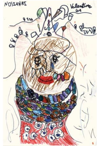
Nosianai, según una niña de 6 años.

Antes de terminar, Nosianai deberá seguir otra tradición, pero esta vez mucho más agradable: ¡no entrará a la cabaña de su suegra hasta verse satisfecha con los regalos que le ofrecen!