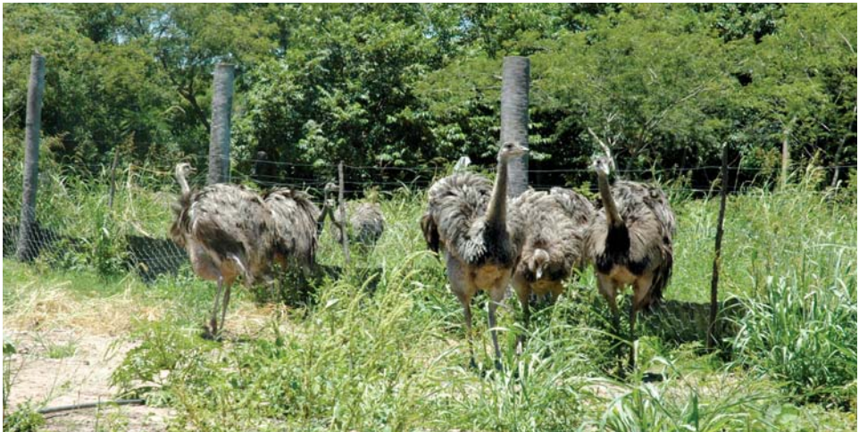
En la región chaqueña el ambiente es propicio para el desarrollo de los ñandúes.

Un mapa puede resultar de gran utilidad para que los chicos ubiquen los lugares donde vivían Mapik y su gente y señalen desde dónde avanzaron los atacantes. De la misma manera, la presentación de láminas o ilustraciones sobre los paisajes y la fauna y la flora del Chaco pueden contribuir para que los chicos enriquezcan sus representaciones sobre el ambiente donde este y otros pueblos guaykurúes habitaban.