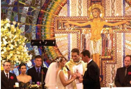
Agencia Estado (AE) - Brasil