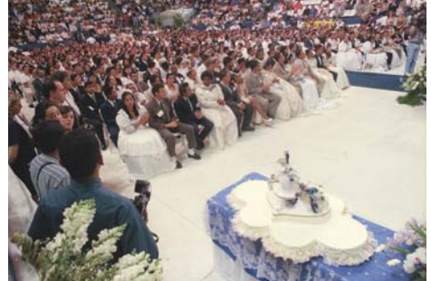
Agencia Estado (AE) - Brasil