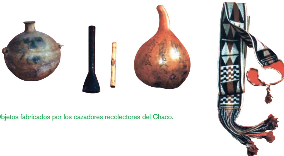
Objetos fabricados por los cazadores-recolectores del Chaco.

La presentación de dibujos que recreen la vida de los guaykurúes y de imágenes sobre sus herramientas y armas 7 así como de los animales que cazaban y las plantas que recolectaban enriquecerá la información de los textos escritos al tiempo que permitirá a los alumnos conocer o profundizar en la utilización de los distintos tipos de fuentes que se usan en la investigación histórica. También, como lo sugerimos en la propuesta de 1 er año/grado, la visita a un museo puede resultar de gran ayuda para ampliar las representaciones infantiles sobre la cultura de estos pueblos. 8