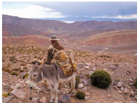
Secretaría de Turismo de la Nación