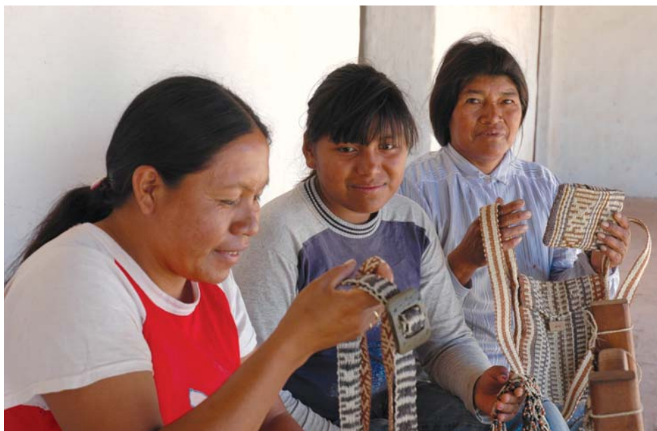
Secretaría de Turismo de la Nación

El tema tiene proyección con el presente ya que en nuestro país viven actualmente muchos descendientes de aquellos pueblos originarios, 5 y lo hacen en condiciones muy duras y precarias, sufriendo con frecuencia actitudes descalificatorias y discriminatorias de algunos sectores de la sociedad argentina.