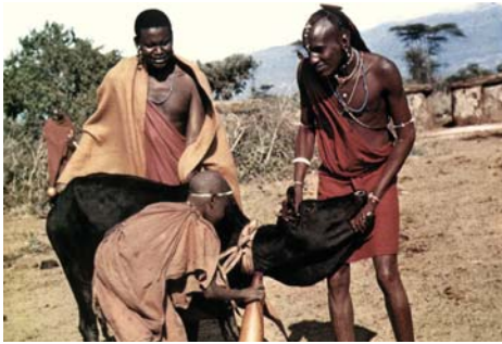
La sangre de buey es usada como medicina y como alimento.