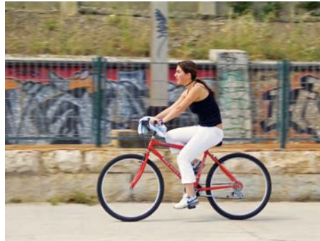
Vecco Instruments Inc.