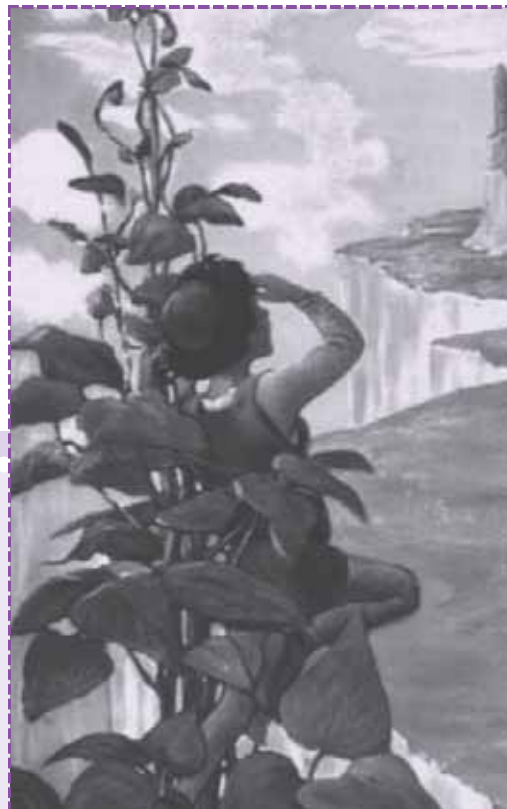
Ilustración de Jessie Willcox Smith. 1916. Swift's Premium Calendar.