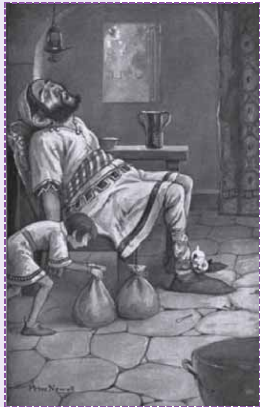
Ilustración de Newell, Peter. Favorite Fairy Tales: The Childhood Choice of Representative Men and Women . New York: Harper & Brothers, 1907.

¡Hay, dichosa de mí, que hijo tan listo tengo!