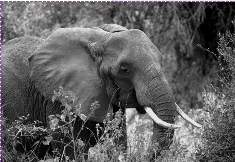
Imagen: Elefante Africano. Stolz, M. En Wikimedia

Tienen una única cría, que se desarrolla durante 22 meses dentro del cuerpo materno. Son mamíferos. Al nacer pesan alrededor de 115 kilogramos.