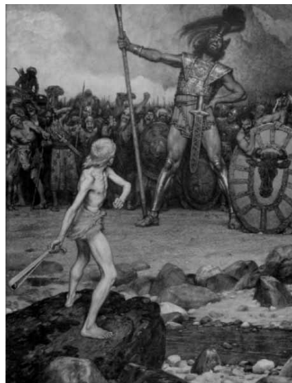
Imagen: Osmar Schindler, David und Goliath.